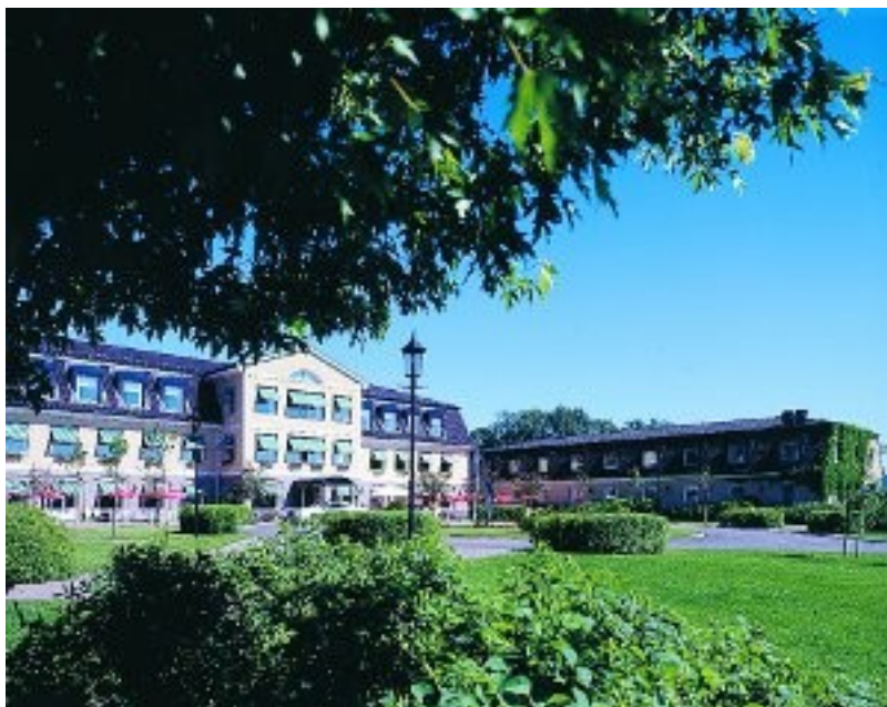
Quality Hotel Selma Lagerlöf.

Värmland när det är som bäst! Så känns det att tänka på Amnestys årsmöte 3–5 maj, förlagt till Quality Hotel Selma Lagerlöf i Sunne. Det är fantastiskt att vi får chans att vara på ett så härligt ställe till en sådan rimlig kostnad. Nu hoppas vi förstås att så många medlemmar som möjligt tar chansen att komma dit.