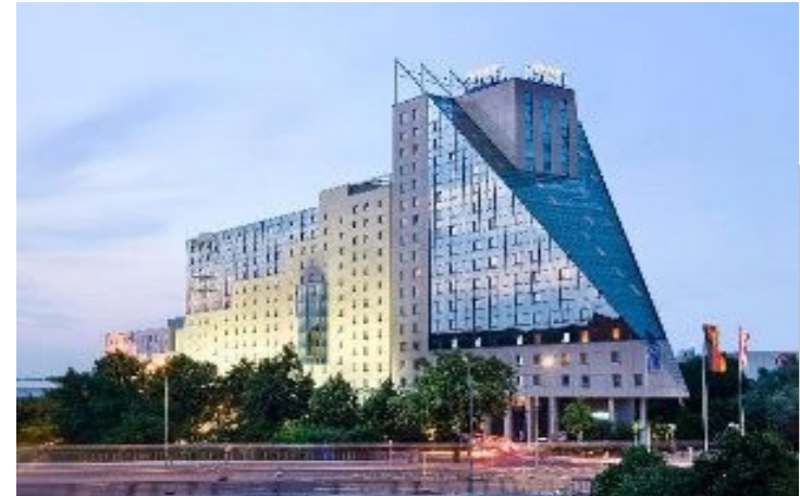
Konferensanläggningen Estrel i Berlin där ICM kommer hållas 18-22 aug

I resolutionen till ICM lyfter vi behovet av att gemensamt bekräfta internationell solidaritet, opartiskhet och oberoende som Amnestys kärnvärden – och skapa mekanismer som gör att de efterlevs i hela organisationen. Som exempel menar styrelsen att opartiskheten inte får riskeras vid arbete på eget land och att vi måste hitta ett arbetssätt där vi kan garantera att Amnestys uttalanden alltid är korrekta även vid snabba reaktioner på akuta människorättskriser. En första version av resolutionen är nu inskickad för beredning och under våren kommer arbetet med att förfina och förankra resolutionen att fortgå.