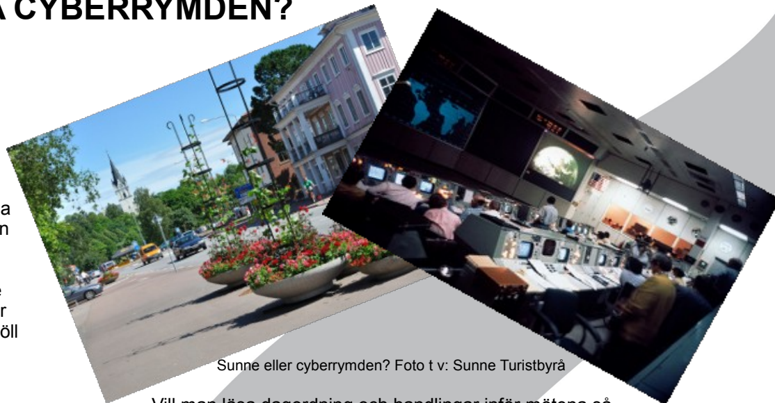
Sunne eller cyberrymden?

Ett av de förslag som styrelsen inte har nappat på var idén att låta direktsända styrelsesammanträdena över webben. Det är redan idag möjligt för de medlemmar som så önskar att vara med som åhörare vid våra sammanträden. Vi tror inte att intresset för att följa mötena via webben är så stort att det är värt kostnaderna i form av tid och pengar.