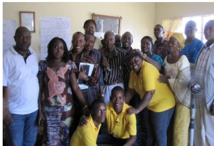
Gamla och nya styrelsemedlemmar och anställda i Amnesty Sierra Leone.

Under vårt besök i Sierra Leone arrangerade vi från svenska sektionen en "board transition workshop" som gick ut på att föra över så mycket kunskap som möjligt från de avgående styrelseledamöterna till den nya styrelsen. I flera av övningarna var även personalen med för att skapa ett bra arbetsklimat och en arbetsordning mellan styrelsen och personalen. Vi hann även ha samtal om framtida utmaningar och behov i sektionen samt om sektionens arbete, till exempel inom kampanjen för mödrahälsa, där sektionen har rönt stora framgångar.