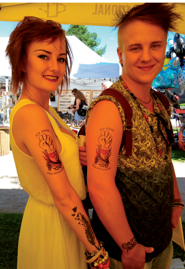
Tatueringen för kampanjen Min Kropp Mina Rättigheter är populär!

Arbetet kring avkriminalisering av abort på Irland inleddes i och med lanseringen av Amnestys rapport She's not a criminal i juni 2015. Den svenska sektionen har arbetat med att synliggöra den restriktiva abortlagstiftning som finns på Irland genom en sommarkampanj och i slutet av året besökte vi ambassaden. Aktivister har under sommaren deltagit i flera stora festivaler runtom i Sverige, skrivit blogginlägg och spridit rapporten.