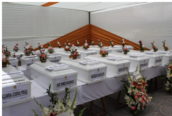
Att identifiera kvarlevorna är en viktig del av ett MR-arbete för att ge anhöriga visshet om vad som hänt. Bilden från Peru innan en jordfästningsceremoni av offer för övergrepp från inbördeskriget på 1980-talet.

I Argentina, Peru och El Salvador arbetar lokala MR-organisationer för att klara upp övergrepp mot de mänskliga rättigheterna som skedde under inbördeskrig och militärdiktaturer. Amnestyfonden har gett stöd till organisationer som arbetar med utredningar och driver rättsfall med målet att lagföra de ansvariga.