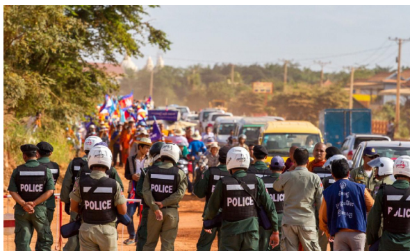
Kambodja, december 2014: kravallpolis bevakar MR-marschen.