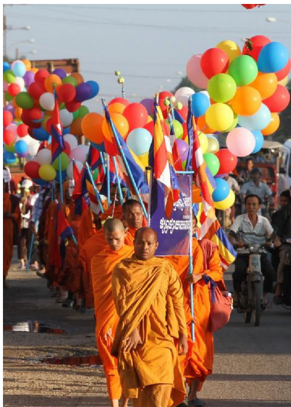
Kambodja, december 2014. Buddhistiska munkar går i tåten för MR-demonstrationen på väg in mot huvudstaden.

I Kambodja har stöd givits till en MR-organisation för att organisera ett stort flerdagars demonstrationståg som i år fokuserade på problemen för landrättsaktivister. Denna marsch som under flera år har genomförts kring den 10 december för att högtidlighålla den Internationella MR-dagen, har betytt mycket för att lyfta fram MR-frågorna i landet.