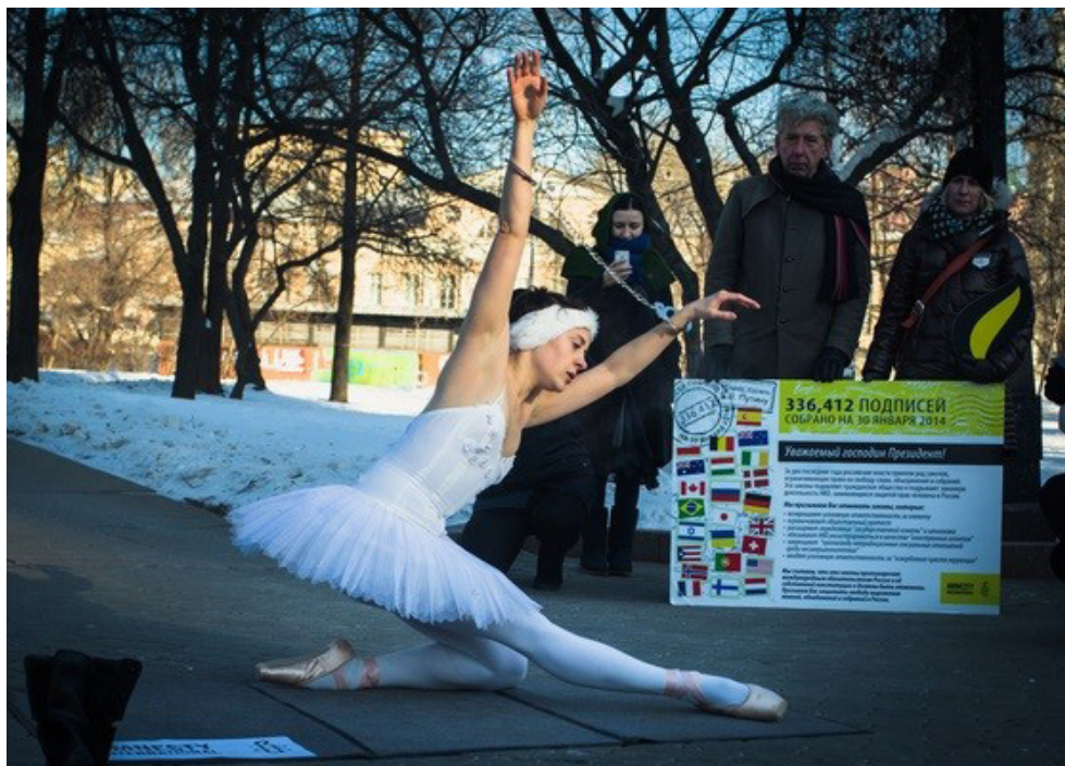
Ballerinan genomför en enmansprotest vid en överlämning av 200 000 underskrifter i protest mot Rysslands människorättskränkningar.