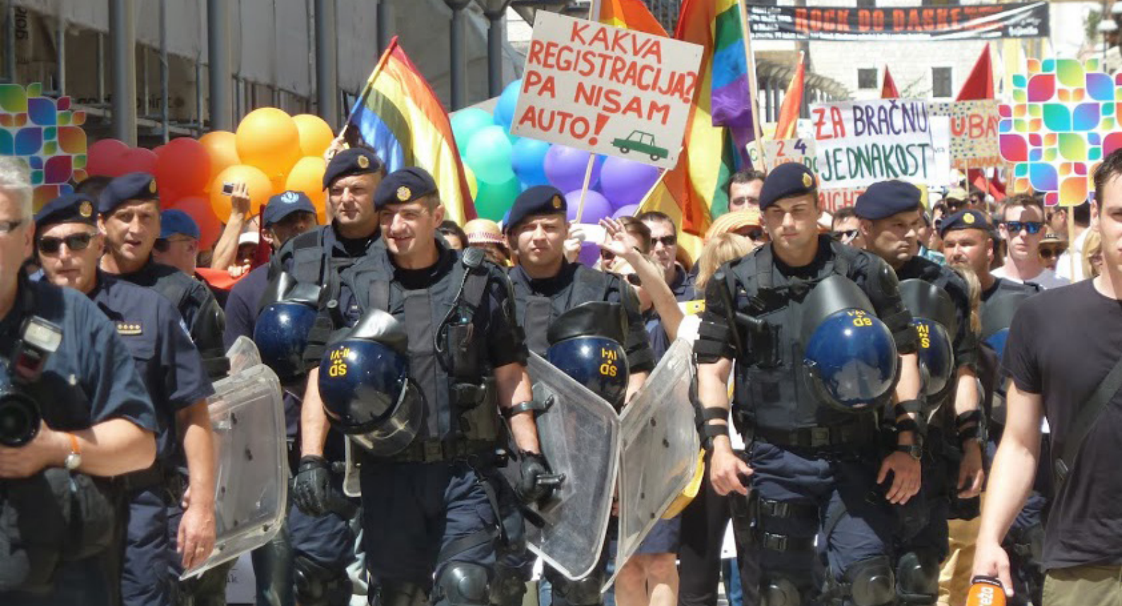
Prideparaden i Split var hårt bevakad.