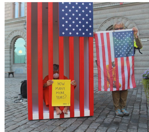
Manifestation på Mynttorget vid president Barack Obamas besök i Sverige.

Amnesty fortsatte arbetet med att kräva att Guantánamo stängs och att de personer som sitter fängslade antingen ställs inför rätta i en rättvis rättegång eller försätts på fri fot. I samband med Barack Obamas besök i Sverige anordnade vi en manifestation på Mynttorget i Stockholm. Vi uppmärksammade också besöket genom en mängd Facebookaktiviteter. Vi hade under året kontakt med några riksdagsledamöter som är engagerade i frågan.