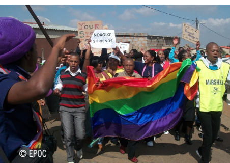
Sydafrikanska aktivister protesterar mot diskriminering av hbt-personer.

Sektionen har under året arbetat med aktioner i Uganda, Ryssland, Kamerun och Sydafrika. Både i Uganda och Ryssland lades det fram hbt-fientliga lagförslag som allvarligt skulle inskränka på hbt-personers rättigheter. Grupper arbetade aktivt med ett aktionsfall i Kamerun där en man dömts till fängelse för att ha haft en sexuell relation med en annan man. Månadens aktion i juni uppmärksammade ett fall i Sydafrika där en kvinna mördats för att hon var lesbisk. En positiv nyhet var att Malawi i november tillsvidare upphävde lagar som kriminaliserar samkönade sexuella relationer i avvaktan på beslut om att de förhoppningsvis ska avskaffas. Sektionen deltog i Pride-parader i Stockholm och Göteborg och gav ekonomiskt stöd till deltagandet i Baltic Pride för medlemmar från Amnesty i Slovakien.