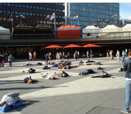
Människor faller till marken på Sergels torg i en manifestation mot vapenhandeln i världen.

Arbetet för att få fler länder att ansluta sig till den internationella brottmålsdomstolen (International Criminal Court, ICC) fortsatte under året genom ICC-gruppen inom Amnestys juristgrupp. Sektionen arbetade dessutom för ett kriminaliserande av tortyr i svensk lagstiftning bland annat genom samtal med politiker under Almedalsveckan och i kontakter med regeringskansliet. Ett samarbete med Röda Korset etablerades också gällande denna fråga. Frågan om straffrihet togs upp vid ett antal ambassadbesök under året och i samtal med UD.