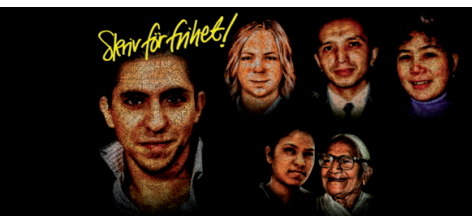
Kampanjen Skriv för frihet lyftes för fjärde gången i svenska sektionen hösten/vintern 2014.

bete. Under året har sektionen arbetat med ett stort antal enskilda asylärenden och flera rapporter har publicerats som visar hur EU:s regelsystem och gränskontroller hindrar flyktingar från att söka asyl i Europa och gör att de riskerar livet på vägen hit. I dag finns det inga lagliga vägar att ta sig till EU om man är i behov av att söka skydd. Många tvingas att använda sig av människosmugglare. Inför valet till EU-parlamentet i maj genomfördes kampanjen SOS Europa för att uppmärksamma migranters, flyktingars och asylsökandes mänskliga rättigheter i Europa och vid dess gränser.