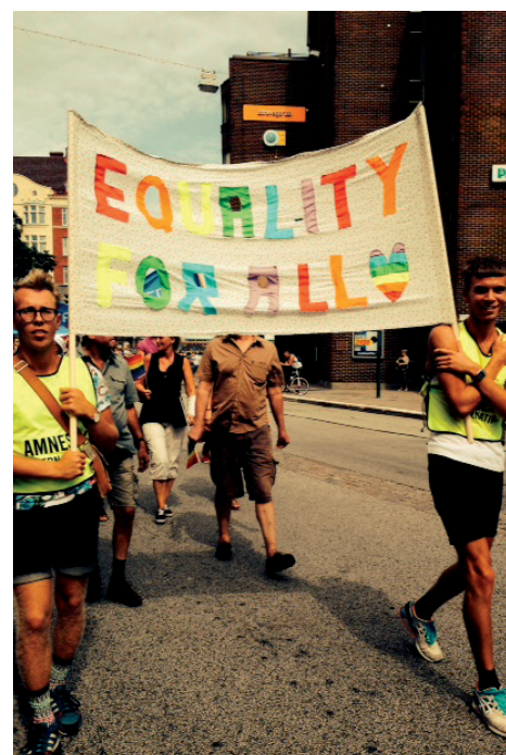
Regnbågsfestivalen i Malmö 2014. HBTQ-gruppen i Malmö samt ett flertal andra lokala grupper deltog.

PostkodLotteriet har sedan starten 2005 delat ut 6 miljarder kronor till den ideella sektorn. PostkodLotteriet är tillsammans med sina systerlotterier i Holland och Storbritannien världens andra största privata givare till ideell verksamhet.