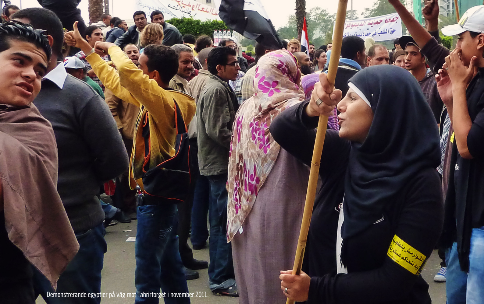
Demonstrerande egyptier på väg mot Tahrirtorget i november 2011.