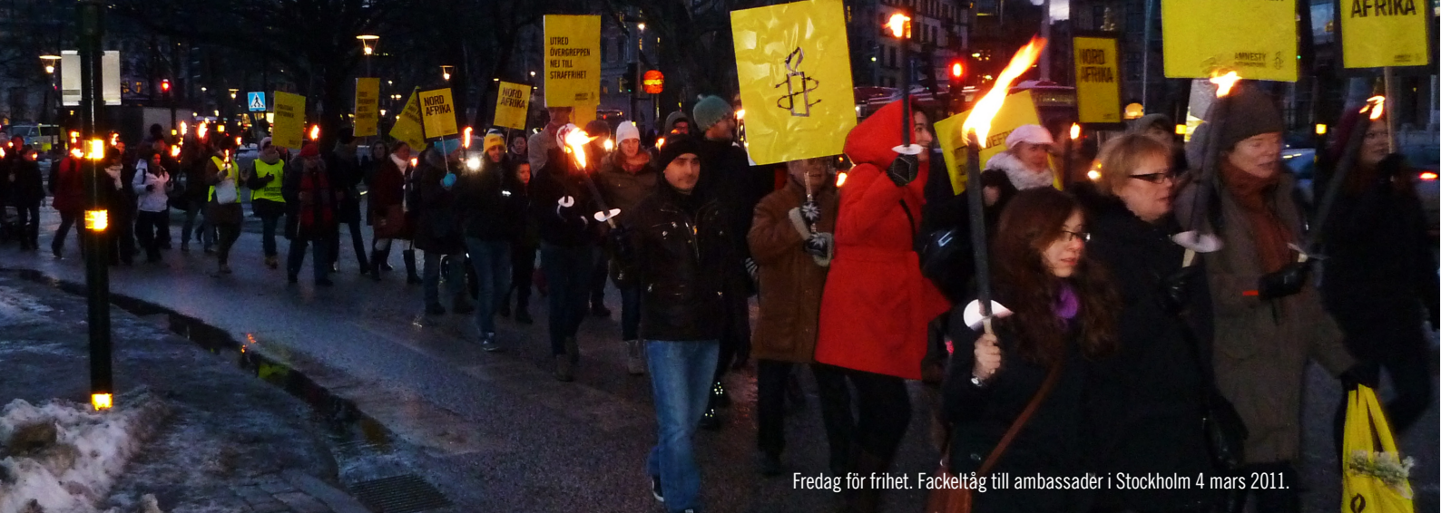
Fredag för frihet. Fackeltåg till ambassader i Stockholm 4 mars 2011.

under Almedalsveckan och sommarens festivaler. Under aktionsdagen mot dödsstraffet den 10 oktober deltog 51 Amnestygrupper på 40 orter. Bland annat samlade aktivisterna in namn mot dödsstraffet i Vitryssland. Senare under året överlämnades 250 000 globalt insamlade namnunderskrifter till de vitryska myndigheterna.