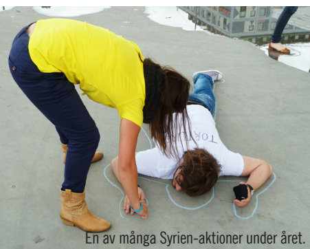
En av många Syrien-aktioner under året.

Under året har Amnesty även arbetat med att förhindra tvångsvräkningar av människor i ett antal utvalda länder, däribland invånarna i Port Harcourt, Nigeria samt romer i Italien.